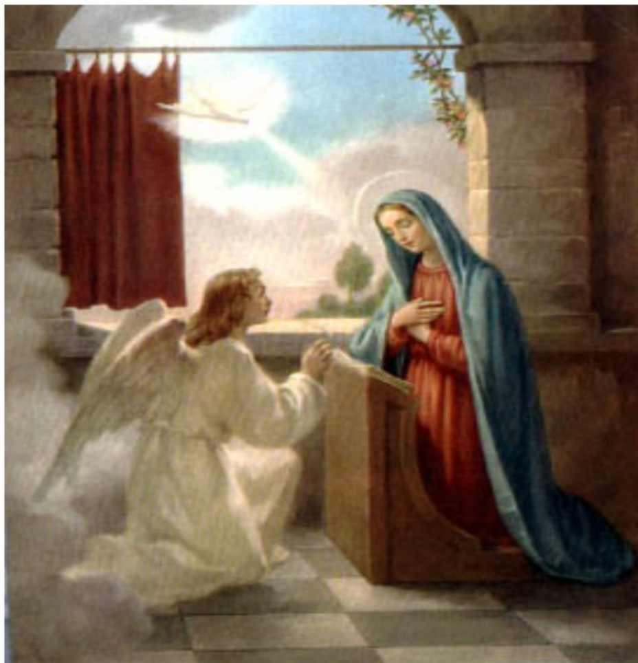
Annunciation to the Virgin Mary